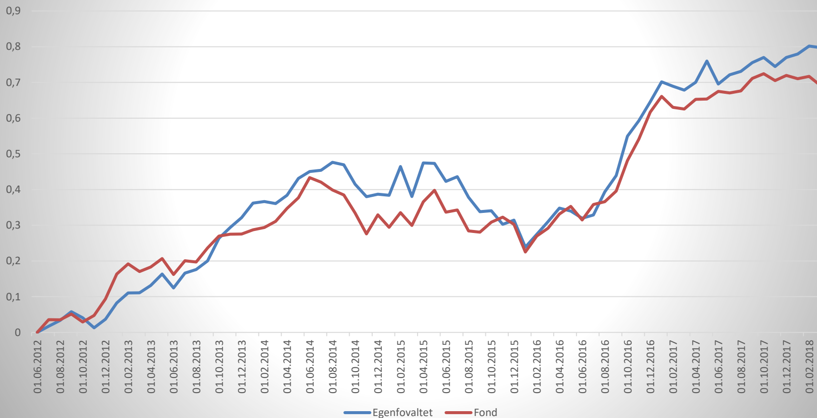
Norske aksjer egenforvaltet vs fond